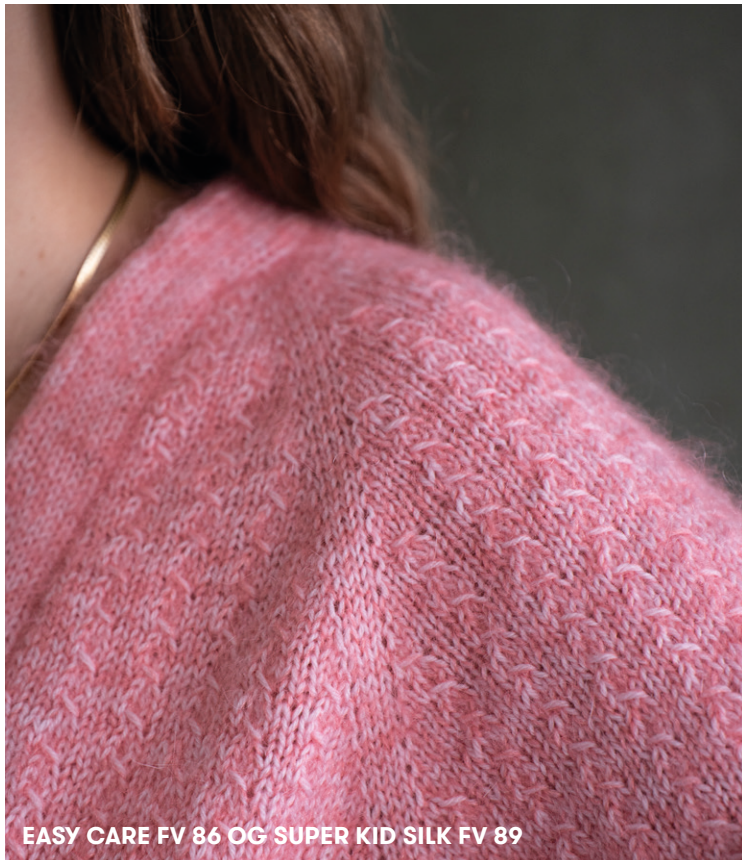
EASY CARE FV 86 OG SUPER KID SILK FV 89