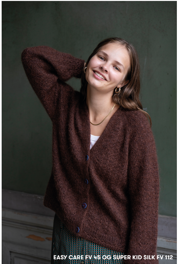
EASY CARE FV 45 OG SUPER KID SILK FV 112