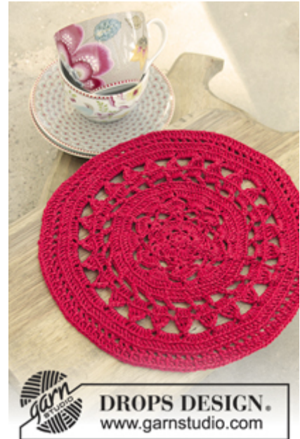
DROPS Extra 0-1334

Alternativt garn – Se hvordan du bytter garn her Garngruppe A til F – Brug samme opskrift og byt garn her Garnforbrug ved alternativt garn – Brug vores garn-omregner her