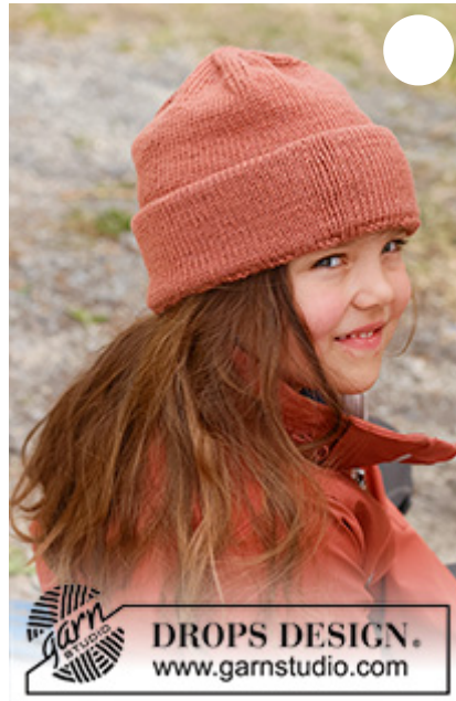
DROPS Children 44-9

Garnforbrug ved alternativt garn – Brug vores garnomregner her