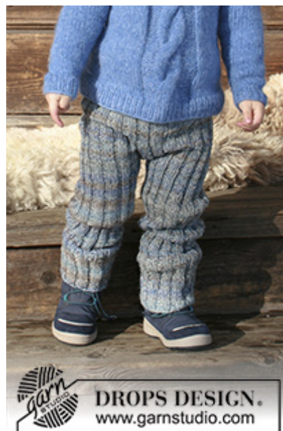
DROPS Children 30-22

200-250-300-300-300-400 g farve 604, havudsigt