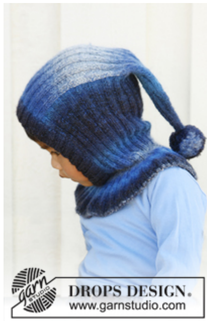
DROPS Children 22-38

DROPS STRØMPEP OG RUNDP (60 og 40 cm) nr 2,5 - eller det p.nr du skal bruge for at få 26 m x 35 p glatstrik på 10 x 10 cm.