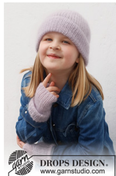
DROPS Children 40-27