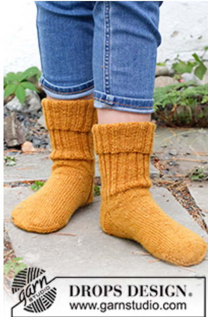
DROPS Children 41-31

Garnforbrug ved alternativt garn - Brug vores garn-omregner her