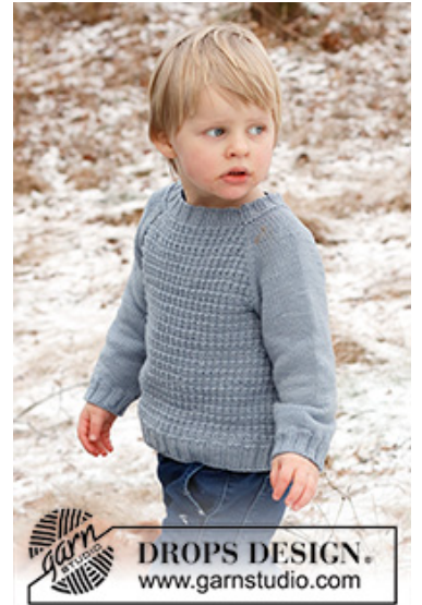
DROPS Children 41-16

Garnforbrug ved alternativt garn – Brug vores garn-omregner her