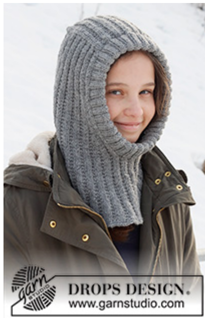
DROPS Children 37-28