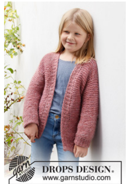
DROPS Children 40-12

Garnforbrug ved alternativt garn – Brug vores garn-omregner her