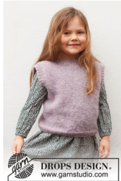
DROPS Baby 38-24

Garnforbrug ved alternativt garn – Brug vores garn-omregner her