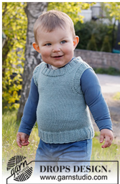
DROPS Baby 38-8

Garnforbrug ved alternativt garn – Brug vores garn-omregner her