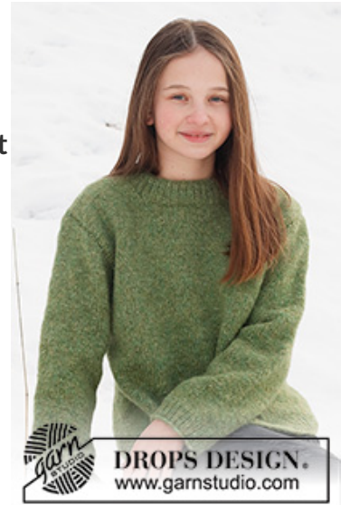
DROPS Children 41-12

Garnforbrug ved alternativt garn – Brug vores garn-omregner her