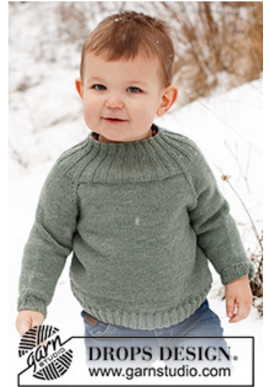
DROPS Children 41-9

Garnforbrug ved alternativt garn – Brug vores garn-omregner her