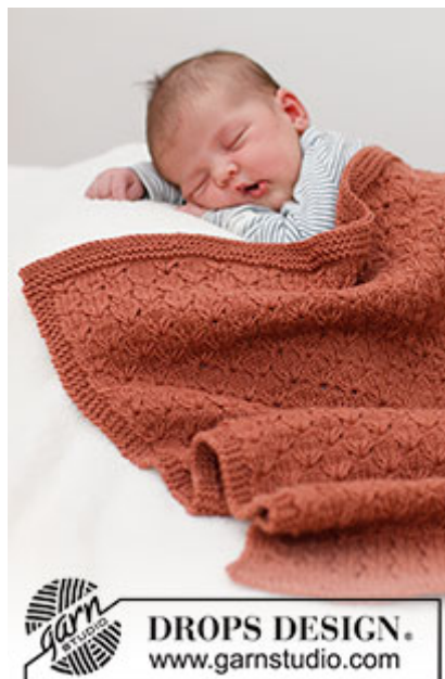
DROPS Baby 39-6

Garnforbrug ved alternativt garn – Brug vores garn-omregner her