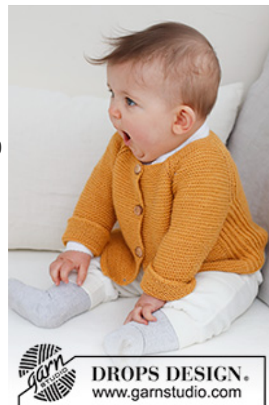
DROPS Baby 43-10

Garnforbrug ved alternativt garn – Brug vores garn-omregner her