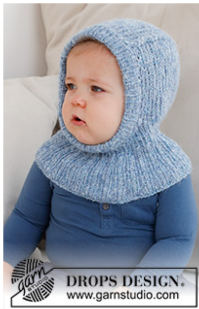
DROPS Baby 42-20

Garnforbrug ved alternativt garn – Brug vores garn-omregner her