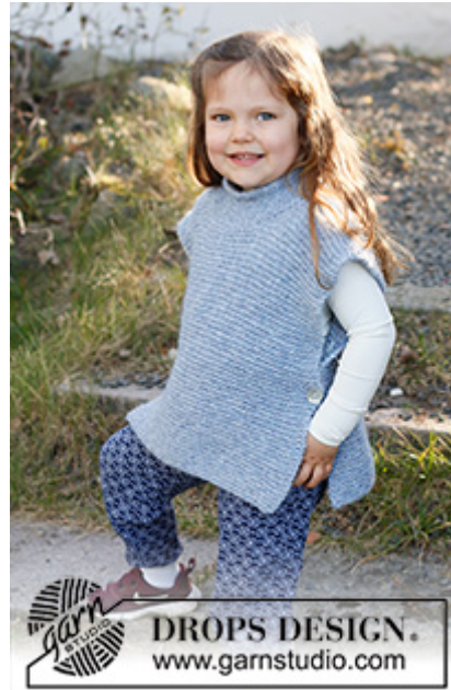
DROPS Baby 38-15

Strikkefasthed – Se hvorfor og hvordan du måler her Alternativt garn – Se hvordan du bytter garn her Garngruppe A til F – Brug samme opskrift og byt garn her Garnforbrug ved alternativt garn – Brug vores garnomregner her